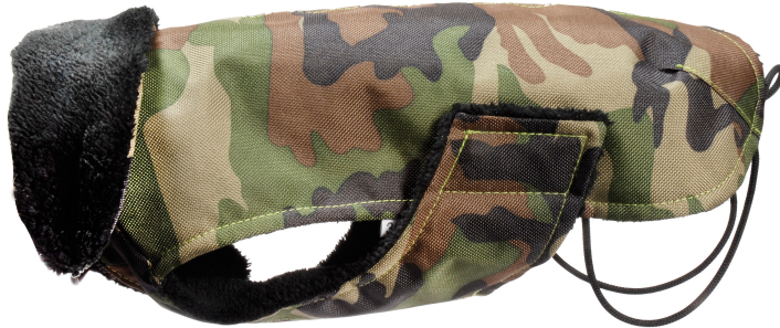
TABELLA IMP. FODERATO

Neck girth (C): to be made at the height of the collar position.