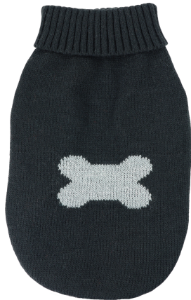
TABELLA MAGL. MOONLIGHT

Neck girth (C): to be made at the height of the collar position.