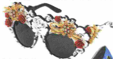
Dolce & Gabbana Eyewear

Tagliatelle al garofano, frittata al geranio, gelato al gelsomino: è tempo di flower diet