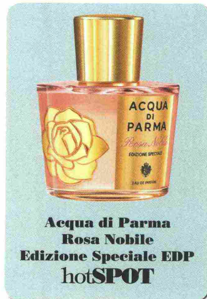
Acqua di Parma Rosa Nobile Edizione Speciale EDP hotSPOT