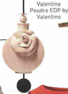
Valentina Poudre EDP by Valentino