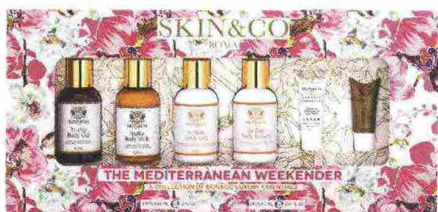
Skin&Co Roma The Mediterranean Weekender-Travel Kit Beauty. Bagnodoccia-Crema Corpo-Siero Viso-Crema Viso. Su www.qvc.it