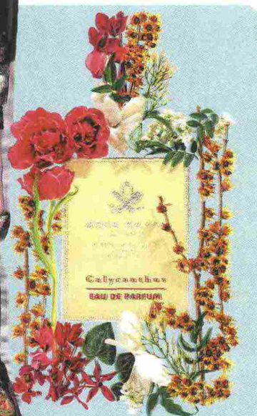
Acqua Kappa Calycanthus EDP hotSPOT

È una zinnia l'ultimo fiore sbocciato nello spazio, sulla ISS. Il primo fiori nel 1982