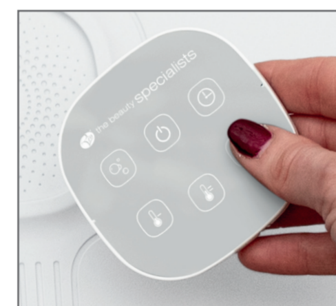
Detachable remote control