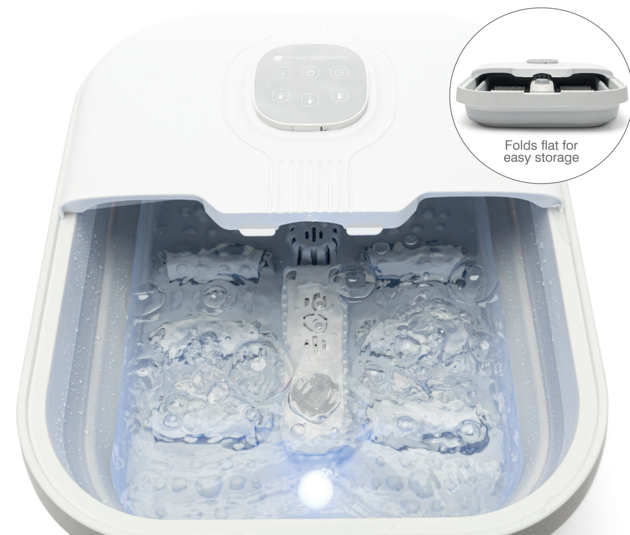
Folds flat for easy storage