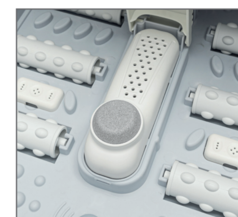
Pumice stone pedicure tool