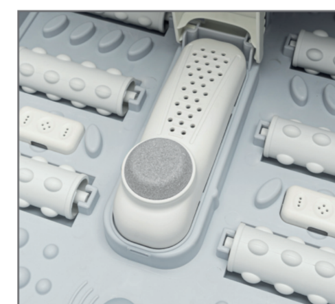
Pumice stone pedicure tool