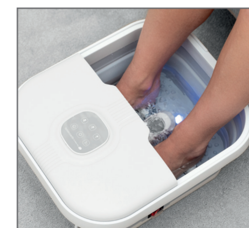
Powerful 500W heater