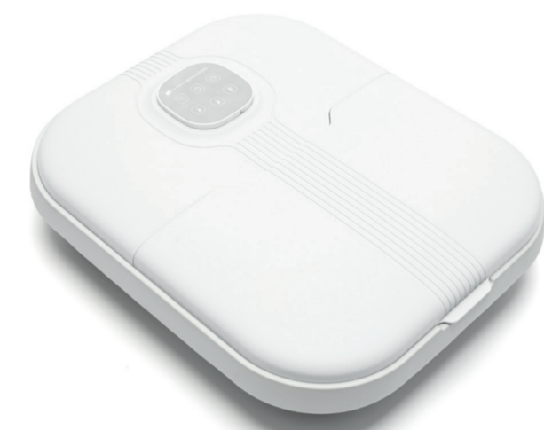
Folds flat for easy storage