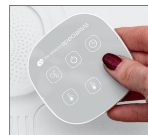
Detachable remote control