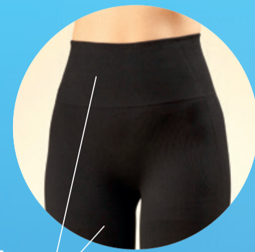
Alge Marine Guam® e Minerali Bioattivi

Grazie al massaggio attivo rassoda, snellisce e rimodella gambe e glutei anche nelle zone più ostinate