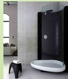
Doccia in vetro o Plexiglas

WC- Lavandini Vasche da bagno in ceramica o in marmo